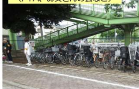
運動会への協力 (PTA、お父さんの会など)