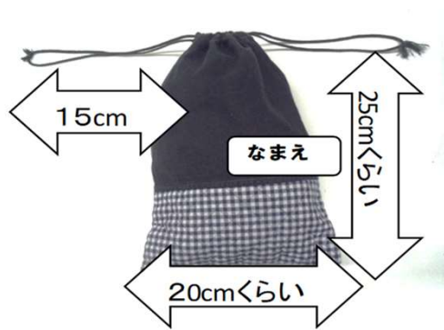
道具袋 （巾着を縛った状態で、紐の長さ 15cm）